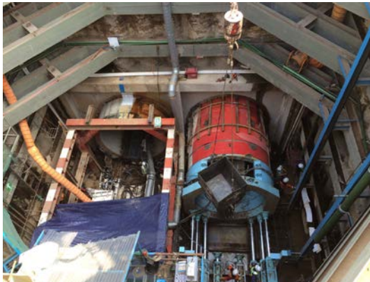
発進状況(掘進機外形 \Phi 4,100\text{m/m} )