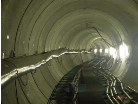
内径 \Phi 3,500\text{m/m} R=200 の S 字曲線

プロジェクト名 CILIWUNG SUDETAN KBT PROJYECT 事業費負担 インドネシア政府 事業目的 旧河川のチリウン川と既設放水路のバンジルキャナルを地下トンネルで結ぶことによって、ジャカルタ市内の洪水を防止する工事です。